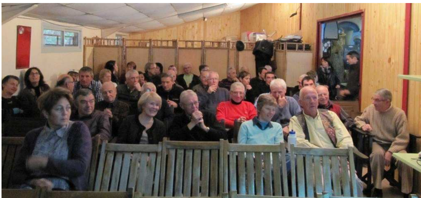
L'assemblée générale le 2 décembre